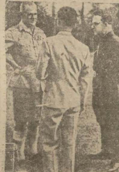
General Wavell Rus generallerle konuşuyor

«Türkler, İtalyan filosunun boğazlardan geçmesine izin vermeyecekler»