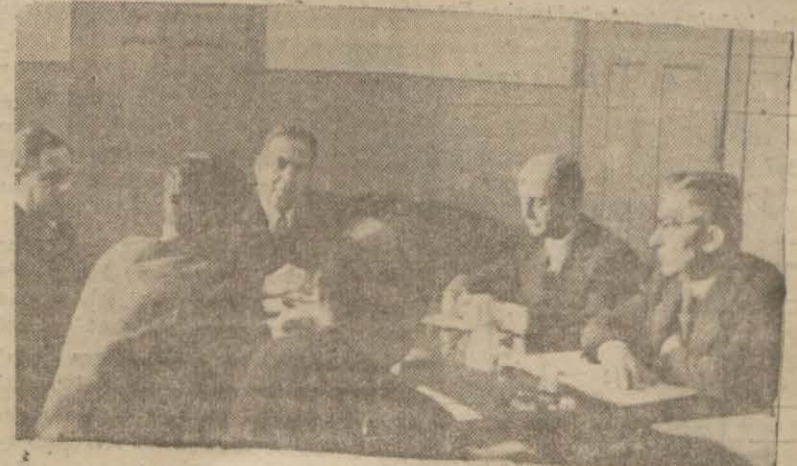
Fiat mürakabe komisyonu dünkü iktisadi esnasında (Yazısı 2 inci sayfanın 3 ve 4 üncü sütunlarında)

Valinin fiat mürakabe komisyonunca verilen bu karar ve sebepleri hakkında beyanatı