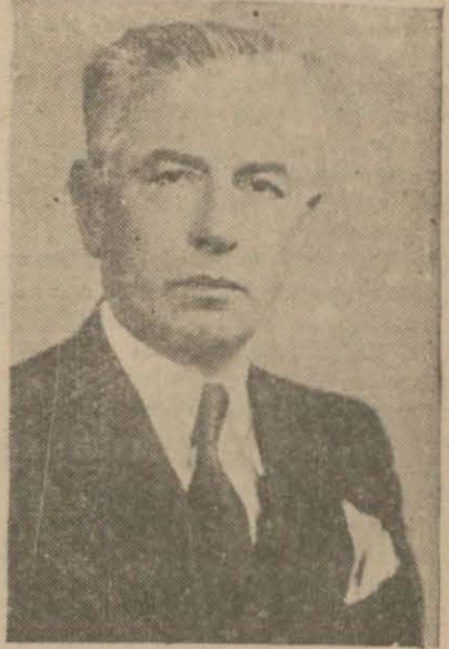
Doktor Ali Fuad Başgil

[Üstadın bu çok şayanı dikkat makale serisine aid ikinci yazıyı bugün üçüncü sayfamızda bulacaksınız]